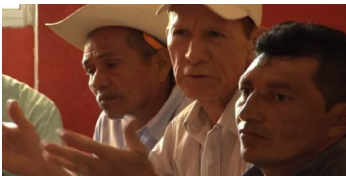
Foto 7 Miembros de la AJAM en reunión

Una duda que aún queda es la posibilidad que tenga la municipalidad para recapacitar Juntas de Agua. Es de esperar que los integrantes de las Juntas cambien y que hubiera necesidad en ciertos momentos de recapacitar a las Juntas. Se considera que la posibilidad de la municipalidad de impartir esta recapacitación aún queda precaria.