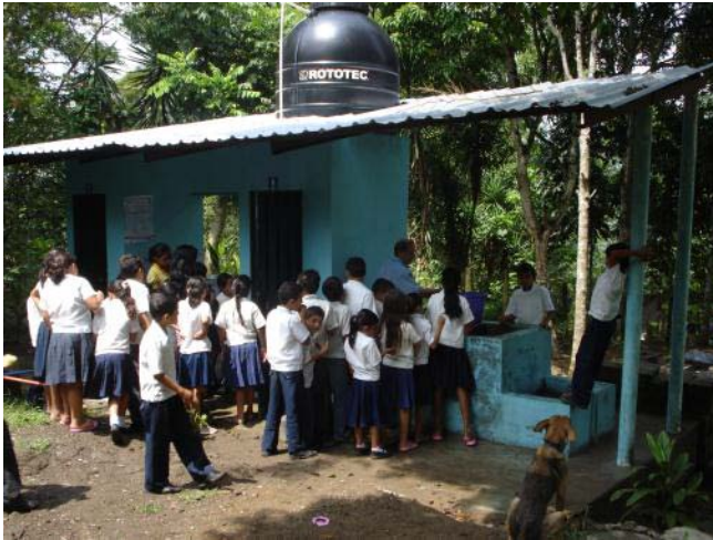
Foto 1 Alumnos lavándose las manos en las instalaciones sanitarias en la escuela de Platanares