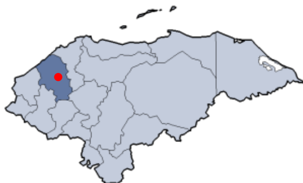
Ilustración 1 Ubicación de la municipalidad de Chinda en el Departamento de Santa Bárbara

En cuanto a la situación inicial de agua y saneamiento, ésta no era tan clara. Los datos del SIAR se encontraban desactualizados; igual como la información sobre el tamaño de la población y hubo diferencias entre diferentes fuentes de información. La tabla a continuación presenta la situación inicial de acuerdo a un diagnóstico específico realizado por WFP en 2007. Como se puede observar la cobertura física en