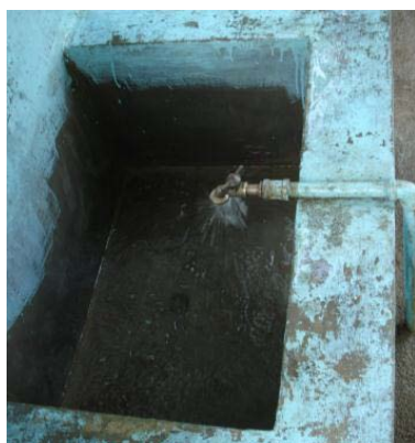
Foto 4 Llave dañado y goteando en una de las pilas escolares

Las escuelas tienen sus llaves y pilas como conexión al sistema de agua comunitario. La escuela, como cualquier otro usuario es responsable de asegurar que no haya fugas en su conexión y cambiar las llaves cuando sea necesario. Obviamente, en una escuela es más difícil realizar este cuidado, sobre todo cuando niños dejan las llaves abiertas, y con un uso tan intensivo llaves y pilas se dañan con mayor frecuencia que en un hogar. De hecho, durante la visita a la escuela de Platanares se pudieron observar fugas en una de las llaves sin que hubieran sido reportadas al fontanero.