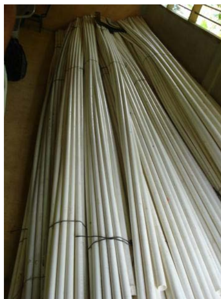
Foto 8 Tubos almacenados en la escuela de Plataneros por falta de una bodega

La concentración del trabajo también ha permitido desarrollar bases importantes para la sostenibilidad. La primordial entre ellas es el hecho que se ha desarrollado una capacidad institucional local, y no sólo capacidad organizacional. Es decir, se ha hecho inversiones en capacidades a todos los niveles: las juntas de agua, la AJAM, la unidad técnica municipal y entidades de apoyo, y fortalecer los vínculos entre ellos. Como todos van a tener un papel en la sostenibilidad de los servicios, se considera de gran importancia que se haya fortalecido la capacidad a