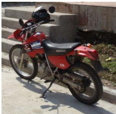
Foto 6 La unidad técnica queda equipada, incluso son su propia

Considerando lo anterior se han logrado grandes avances en el desarrollo de una capacidad organizacional y, tal vez más importante, institucional local. Esta capacidad institucional consiste de 1) las Juntas de Agua, legalmente establecidas y debidamente organizadas, 2) representadas en una AJAM activa como su sombrilla y con 3) vínculos con el municipio con su unidad técnica municipal, incluido formalmente en el organigrama municipal, dotado con